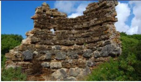
La « basilique »

Que reste-t-il du bâtiment qui surplombe le théâtre-amphithéâtre ? Qu'est-ce que cela pourrait être ? A côté de ce bâtiment, dans une zone qui pourrait avoir été le forum de Lixus, a été découverte une antéfixe en bronze. Où est-elle conservée aujourd'hui ? Qui représente-t-elle ?