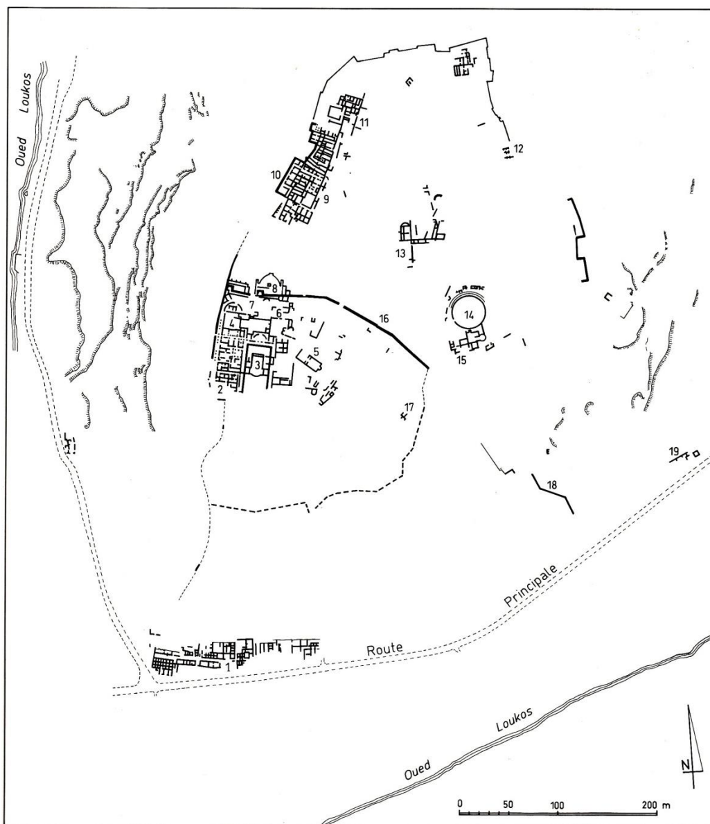
Plan général de Lixus.