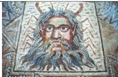
Mosaïque du dieu Océan